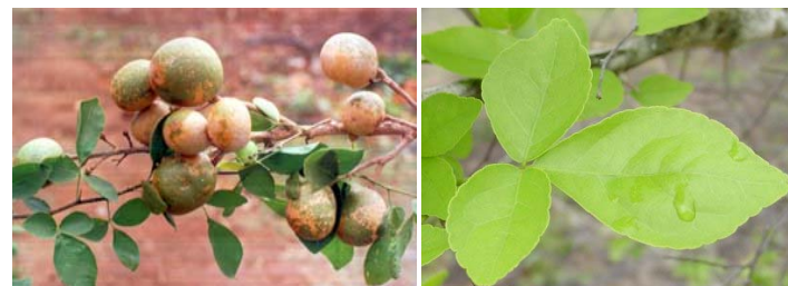
Obr. 3: Plody a listy bilvového stromu (lat. Aegle marmelos ).

Puróhita také šestý den zpravidla vytváří navapatriku – svazek devíti různých rostlin, jimž vévodí banánovník a bilvová větev se dvěma kulatými plody, jež připomínají ženská ňadra. Každá rostlina představuje jeden aspekt Bohyně, který může být buď pokojný, nebo děsivý. V této rostlinné podobě bude také Bohyně následující den probuzena.