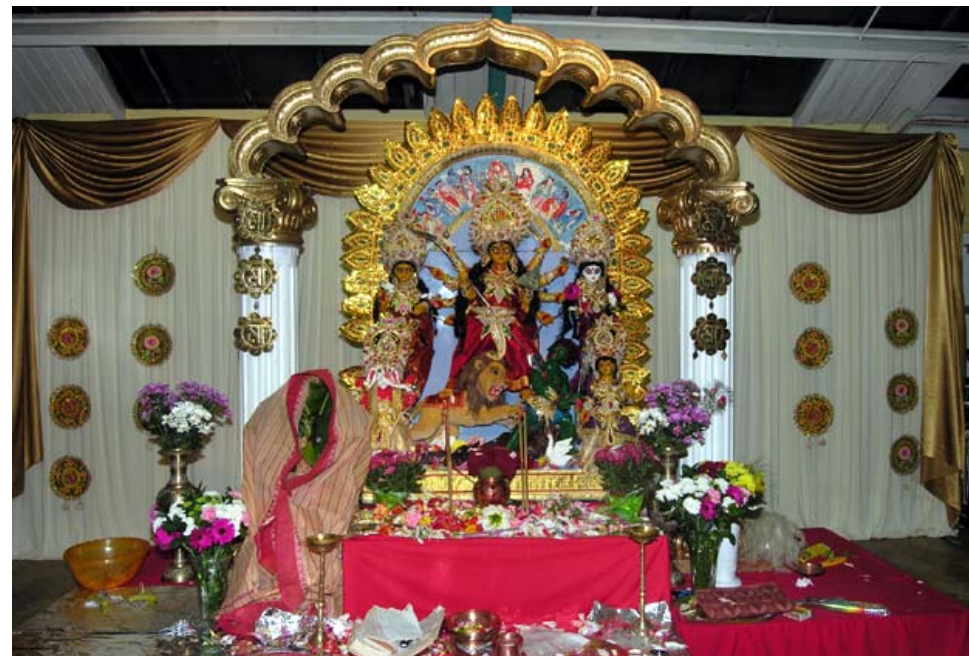
Obr. 4: Konečná podoba oltáře se sousoším. Nalevo v růžovém sáří je vidět navapatrika , před lvem v prostoru mezi klacíky hliněný džbán.

vidí určitou souvislost s vytím šakalů, jež jsou asociováni s šakti (energií) Šivy. 8 K áratí patří také obkružování několika kusy čerstvě vypraného oblečení a kroupení Bohyně vodou z lastury. Na konci obřadu zasypou všichni účastníci Durgu květy. Většina rituálů, které se odehrávají sedmý den, se odehrává i dny následující: je to především koupání Durgy i navapatriky , áratí a předkládání obětí (Bohyně je v tuto dobu již plně probuzená, obřady probouzení se proto dále neprovádějí).