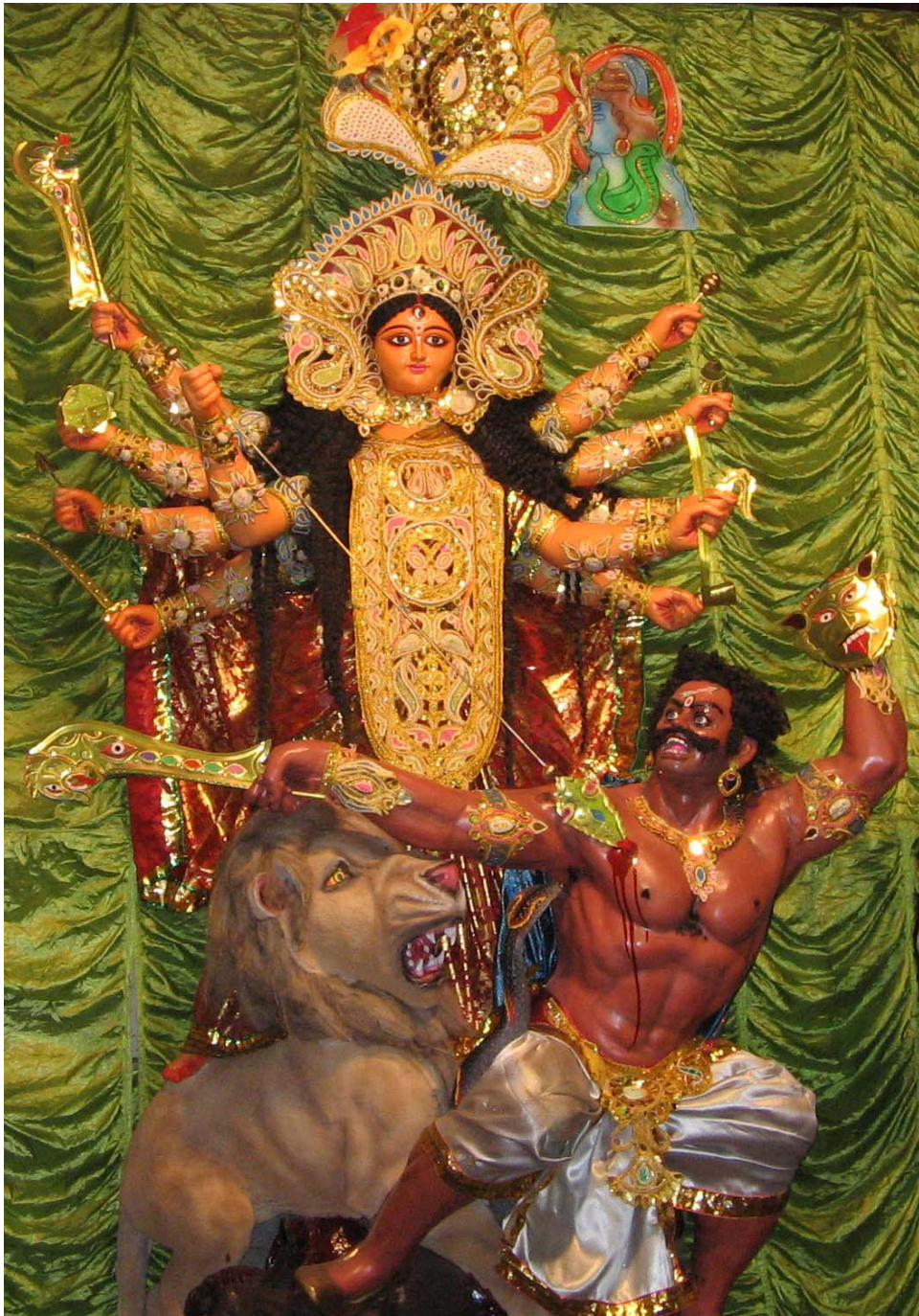
Obr. 1: Durgá zabíjí démona Mahiṣu.